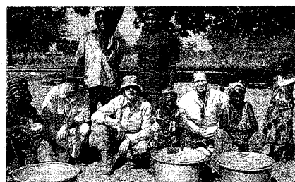
Miembros de la Fundación Ilumináfrica, durante una de sus visitas a la República del Chad.

Más información sobre esta fundación en la web www.luminaffrica.org .